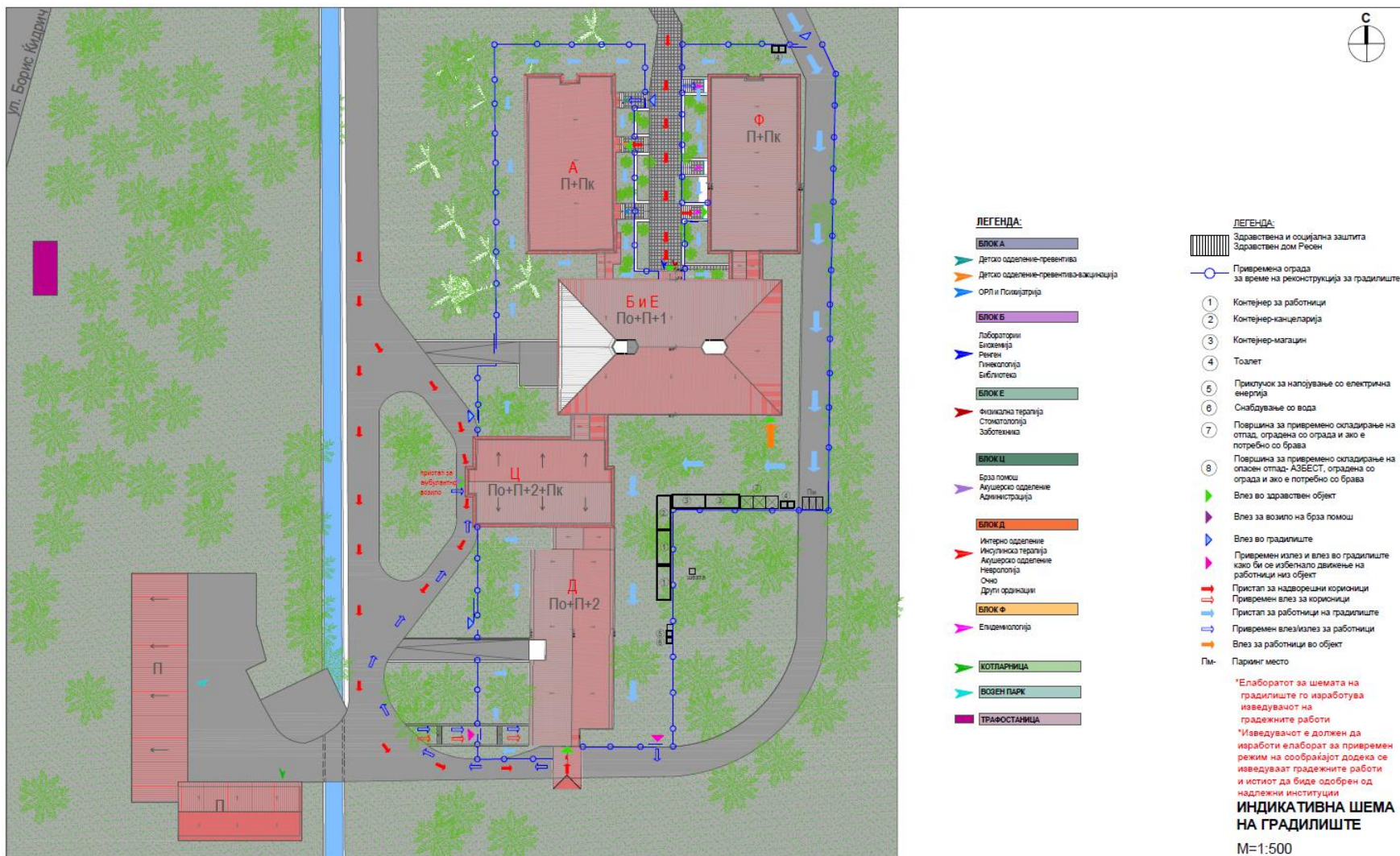
Слика 1 дава индикативен распоред на локацијата на градежната површина во однос на планирањето.